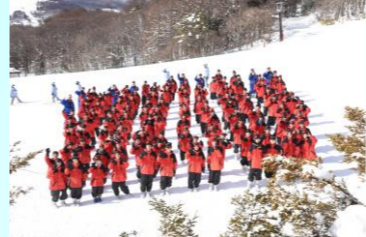
【スキー教室の様子】

II 豊かな心の醸成 (心の教育の充実) 目標値:新たな不登校0 いじめ解消率100% 1 差別やいじめを許さない、認め合う人間関係を作ります。(アンケート、即対応) 2 「考え議論する道徳」を意識した授業を行い、生徒の活躍を見取ります。 3 自分の思いや考えを、思いやりのある言葉で表現できる生徒を育てます。 4 居心地のよい学級・学年づくりを目指し、全教職員で取り組みます。