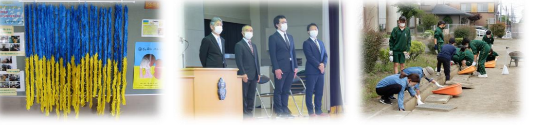
生徒会が全校に呼びかけ完 お世話になった先生への感謝を伝えた離任式 保護者と取り組んだ2年生奉仕作業